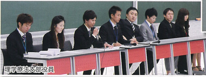
理学療法支部役員