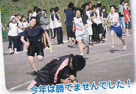
今年は勝てませんでした！