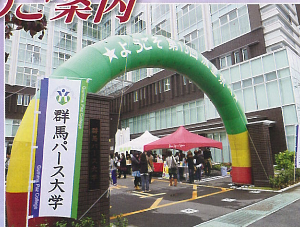
※写真は昨年の様子